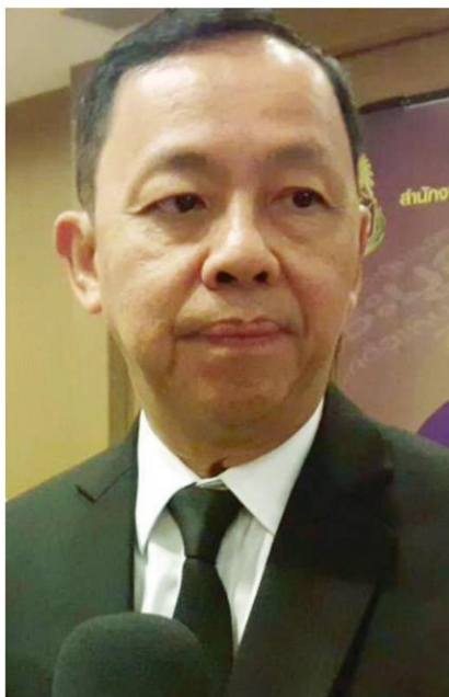
พล.ต.อ.วัชรพล ประสารราชกิจ