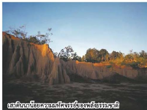
เสาดินน่านน้อยความมหัศจรรย์ของพลังธรรมชาติ

หลากหลายทางชีวภาพ รวมทั้งทำให้มันแล้ง- น้ำท่วม จ.น่าน และภาคกลางของไทย การแก้ ปัญหาคงต้องสร้างหลุมขมหมึกบนพื้นที่สูงเปลี่ยน เขาหัวโล้นไปเขาหัวจุก เหตุที่เลือกพลิกฟื้นเขา หัวโล้นในอุทยานศรีน่าน ทั้งที่วิกฤติหนัก เพราะ