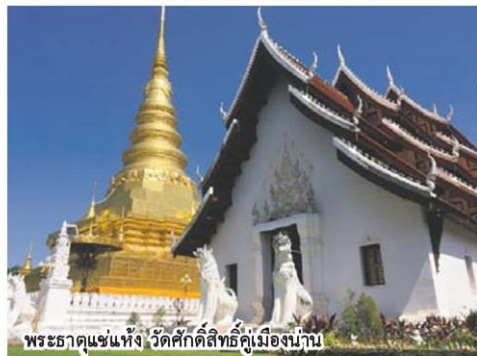
พระธาตุแช่แห้ง วัดศรัทธาสิริวิมาลาเมืองน่าน