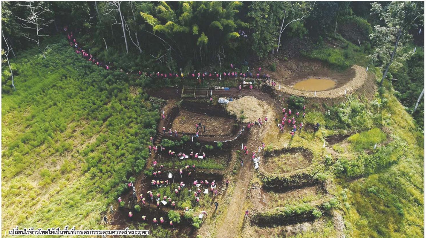
เปลี่ยนไร่ข้าวโพดให้เป็นพื้นที่เกษตรกรรมตามศาสตร์พระราชฯ

“จังหวัดน่าน” ได้ชื่อว่าเป็นพื้นที่ซึ่งมีกิ่งก้านไปด้วยทรัพยากรธรรมชาติ ศิลปวัฒนธรรม และวิถีการดำเนินชีวิตเฉพาะตัว อาทิ ดอยเสมอดาว จุดชมวิวที่งดงามมากที่สุดแห่งหนึ่งของอุทยานแห่งชาติศรีน่าน สูงจากระดับน้ำทะเล 888 เมตร มีแนวสันเขายาว เปิดโล่งกว้าง สามารถชมวิทิวทัศน์ขุนเขาน้อยใหญ่ได้ไกลสุดลูกหูลูกตา เสาดินน่านน้อย ความมหัศจรรย์ของพลังธรรมชาติ