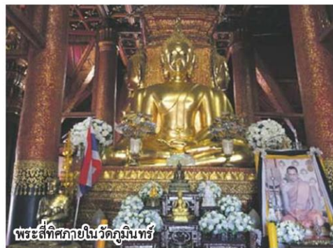
พระสีทิศภายในวัดภูมินทร์